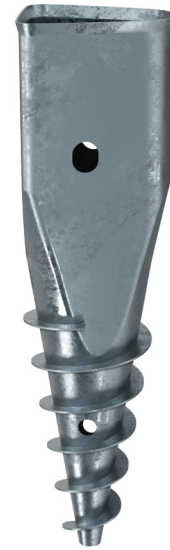
KSF X 135x480-LPS