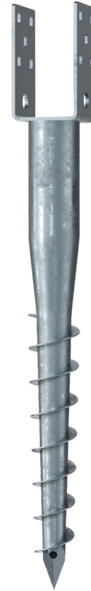
KSF U 60x730-71