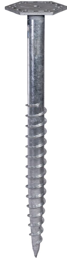
KSF M 76x1300-M24 (SW245/F12)

Eindrehadapter: Z1 Aufsatz-F1234567 Art.-Nr. 21841