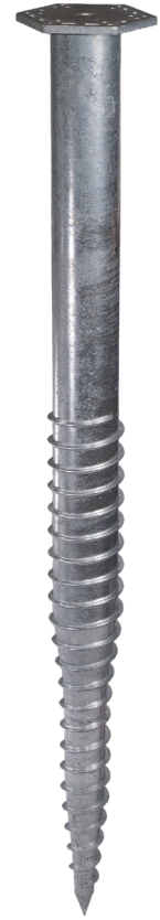
KSF M 140x2100-M24 (SW245-F15)