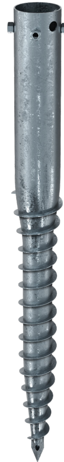
KSF G 114x1300-4xM16

Technische Änderungen vorbehalten! Produkt für den beruflichen Gebrauch nach Instruktion.