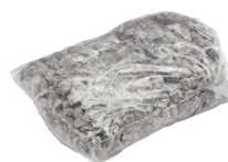
Spezialgranulat 1,50 kg Art.-Nr. 21824