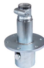
Eindrehadapter: Z1 Aufsatz-I114 Art.-Nr. 21894