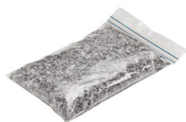
Spezialgranulat 0,50 kg Art.-Nr. 21823