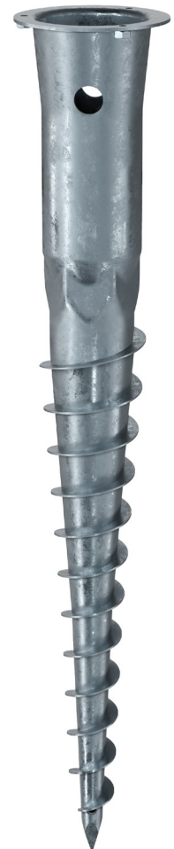
KSF E 89x800-E60

Technische Änderungen vorbehalten! Produkt für den beruflichen Gebrauch nach Instruktion.