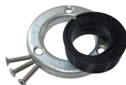
Exzentrersatz-E60 Art.-Nr. 24817