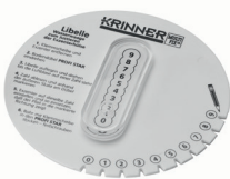
Libelle-E60 Art.-Nr. 24803