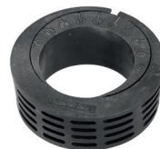
Exzenter-E60 Art.-Nr. 24801