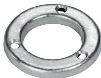
Klemmring-E60 Art.-Nr. 24802