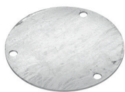
Abdeckung 2 mm-E60 Art.-Nr. 24808