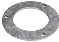
Klemmring für KSF E 140 Klemmring für Schraubfundamente der E-Serie (E76-100)