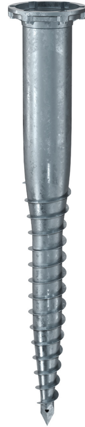
KSF E 140x1300-E76-100

Eindrehadapter: Z1 Aufsatz-E140 Art.-Nr. 21838